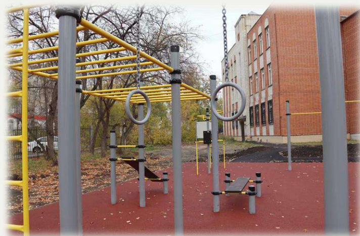
Спортивная площадка Каменск-Уральского педагогического колледжа