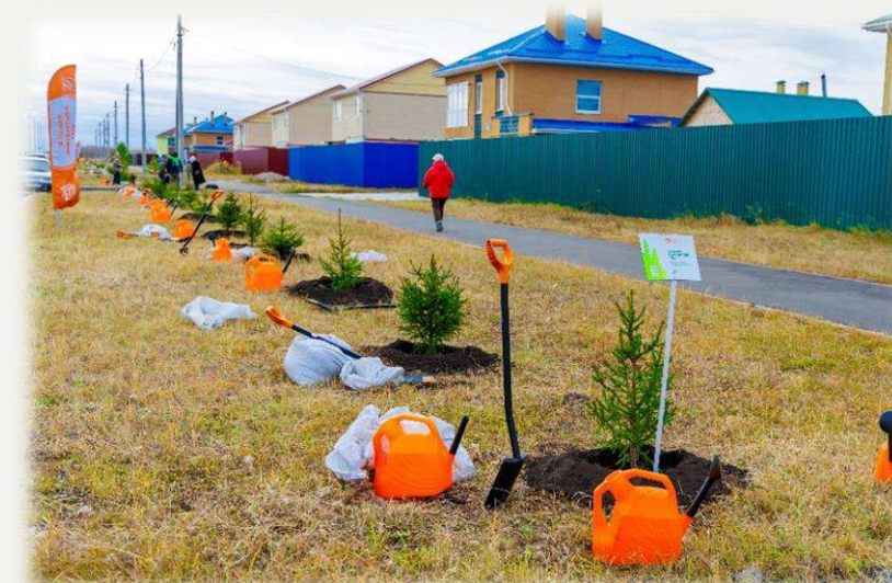
На ул. Анатолия Брижана высажены ели