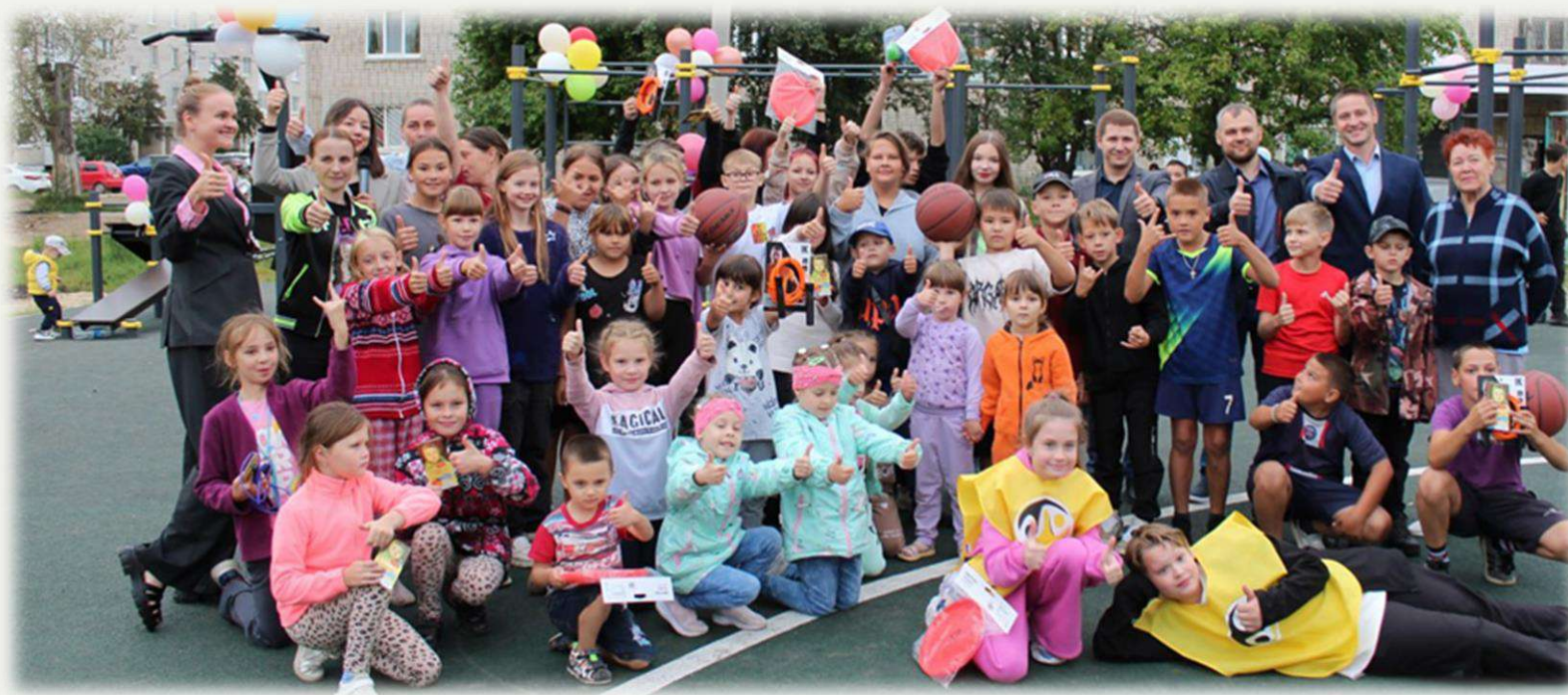
Спортивная площадка в пос. Первомайский