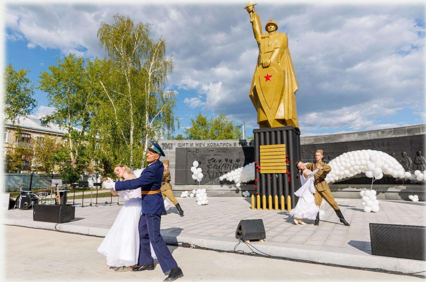
Мемориал «Труженикам тыла»