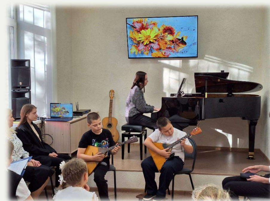
Акустический рояль для Детской школы искусств №1