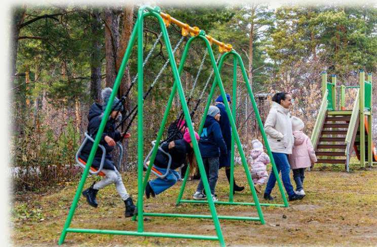
Детская площадка в пос. Мирный