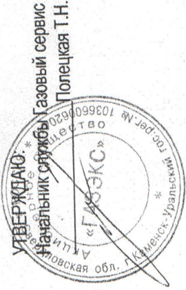
Схема № 1

Схема организации дорожного движения и ограждения места дорожных работ по объекту Газопровод низкого давления до границы земельного участка по адресу: Свердловская область, г. Каменск-Уральский, ул. Тимирязева (кад. № 66:45:0100244:1)