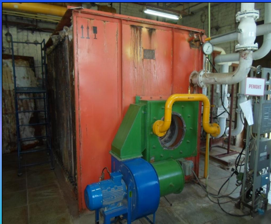
Газовая котельная на ул. Парковая