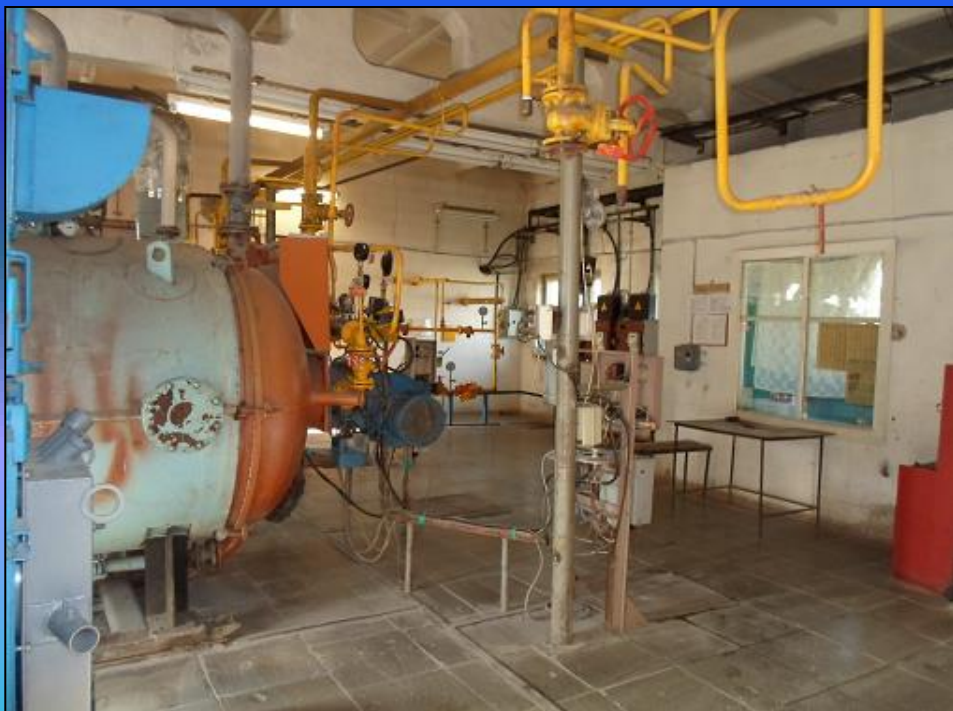
Газовая котельная пос. Силикатный